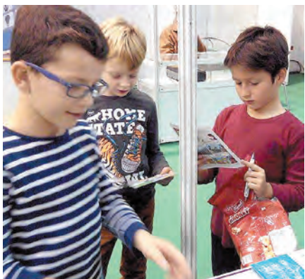
Najmlađi posjetitelji izložbe rado su čitali stripove namijenjene edukaciji poduzetnika u području zaštite intelektualnog vlasništva

G lavni cilj EU IPR Helpdesk programa je edukacija malih i srednjih poduzetnika i izgradnja kapaciteta za učinkovito upravljanje intelektualnim vlasništvom na cjelokupnom teritoriju EU-a. Informativni događaji i edukacijski programi u EU-u su brojni, no za većinu takvih događanja službeni jezik je engleski. Kako bi se prevladala jezična barijera, a znanje i iskustvo u području intelektualnog vlasništva učinkovito prenijelo u različitim europskim regijama, EU IPR Helpdesk je u suradnji s Europskom poduzetničkom mrežom ustanovio program "EU IPR Helpdesk Ambassadors".