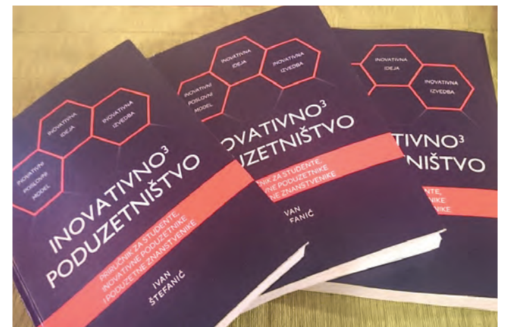
Knjiga INOVATIVNO 3 PODUZETNIŠTVO uskoro izlazi iz tiska. Svoj primjerak možete naručiti na i3p@tera.hr ili 031/251-000

Istovremeno, biti poduzetnik uopće nije komplicirano i ne mora biti previše stresno. Potrebna znanja i vještine su poznati. Dobra vijest za sve sadašnje ili buduće poduzetnike je činjenica da sve to znanje i iskustvo poduzetnici ne moraju stjecati osobno, sasvim je dovoljno da je ono raspoloživo unutar njihova tima. Loša je vijest da to znanje i iskustvo može biti izuzetno kompleksno, interdisciplinarno i teško dostupno. To se dodatno komplicira ako se raspoložive informacije krivo tumače i primjenjuju na krivi način. Neovisno o motivu za poduzetničku karijeru, dobra ideja o inovativ-