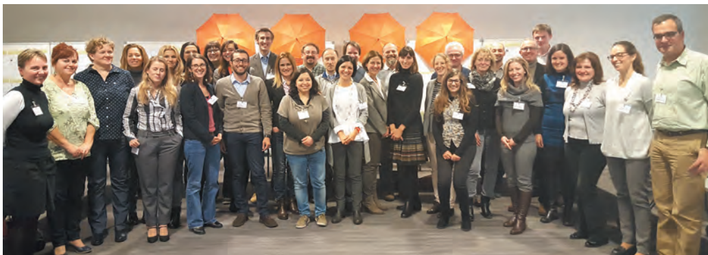
Sektorska grupa Okoliš organizira poslovne susrete u New Delhiju, Indija, u terminu od 11. do 13. svibnja 2016. godine na temu Pametni gradovi (engl. Smart Cities) s posebnim naglaskom na pametne zgrade, pametni transport, pametni IT i komunikaciju i čistu energiju. Za dodatne informacije, konzultantsku pomoć i prijavu sudjelovanja pišite na een@tera.hr ili nazovite broj 031/251-002.

luge na stranom tržištu pomoću profila objavljenog u bazi EEN-a, isto tako, mogu tražiti specijalizirane tehnologije, usluge ili proizvode te partnere i distributere za svoje proizvode i usluge. Iako se radi o Europskoj poduzetničkoj mreži, njeno djelovanje je puno šire i obuhvaća ukupno 56 zemalja, s više od 600 organizacija i 4.000 suradnika koji su angažirani na njenom radu. TERA se u rad sektorske grupe za okoliš uključila početkom ove godine i do sada je sklopila 4 međunarodna ugovora o partnerstvu, što potvrđuje učinkovitost rada ove mreže.