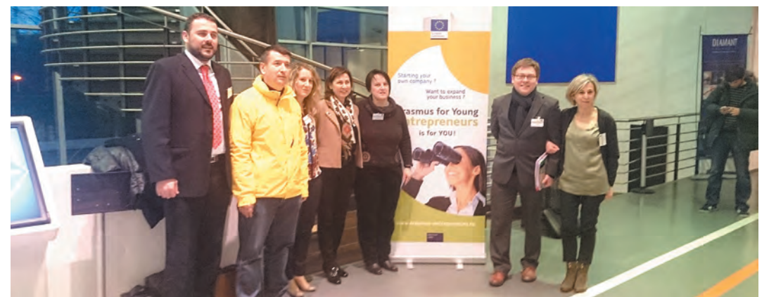
TERA TEHNOPOLIS uključena je u sedmi ciklus programa ERASMUS ZA MLADE PODUZETNIKE kroz konzorcij YOU ENTER IN EUROPE 2 koji vodi Provincia de Pesaro e Urbino iz Italije. Partneri u konzorciju su CONFEDERACIÓN DE ASOCIACIONES EMPRESARIALES DE BURGOS iz Španjolske, MEDNARODNA FAKULTETA ZA DRUŽBENE I POSLOVNE STUDIJE ZAVOD iz Slovenije, GRAD SIRAKUZA, Italija, GOSPODARSKA KOMORA iz Crne Gore i DUBROVAČKA RAZVOJNA AGENCIJA i TERA TEHNOPOLIS iz Hrvatske.

vršavanje, već program usavršavanja orijentiran na postizanje rezultata, odnosno pokretanje poslovanja nakon završetka. Program razmjene prosječno traje 3,5 mjeseci, a bitno je istaknuti da poslodavac mentor nema nikakvih dodatnih troškova jer novi poduzetnik ima financijsku potporu programa. Prijave za sudjelovanje moguće su nakon odabira lokalne kontakt točke TERA, slijedi prijavljivanje koje se sastoji od 4 dijela: prijavnog obrasca, motivacijskog pisma, životopisa i poslovnog plana. Nakon procjene i odabira kandidata slijedi pretraživanje i odabir mentora. U posljednjoj fazi razmjena se odobrava na razini konzorcija i programa.